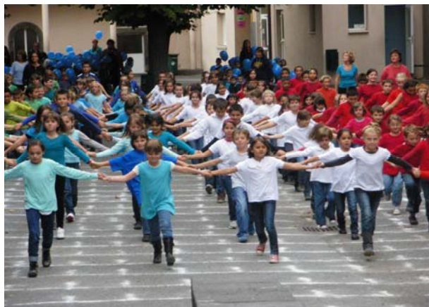
Spectacle d'inauguration du projet Comenius le 16 octobre Plus de 200 enfants réunis pour accueillir les délégations...