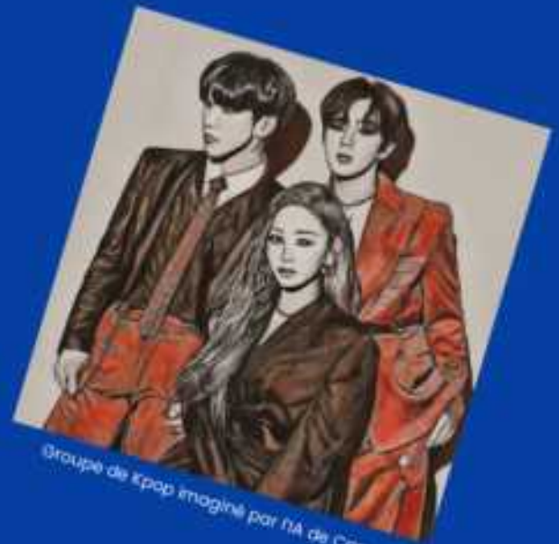
Groupe de kpop imaginé par IIA de Canva