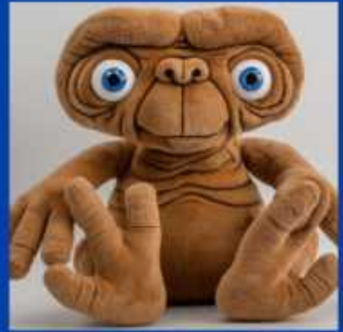
ET en peluche créé par IIA de Canva

Dans le prochain numéro, un dossier KPOP !